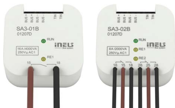
Código EAN SA3-01B: 8595188132350 SA3-02B: 8595188132367